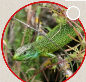
Le lézard à deux raies