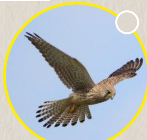
Le faucon crécerelle