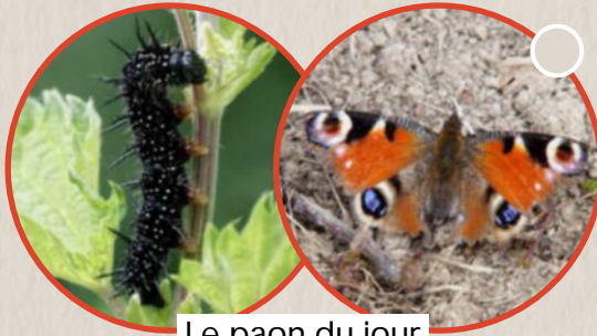
Le paon du jour